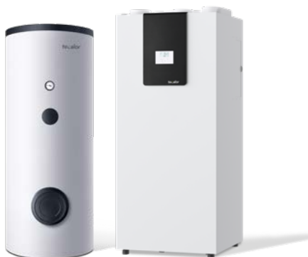
Beispiel mit TSB 300 eco